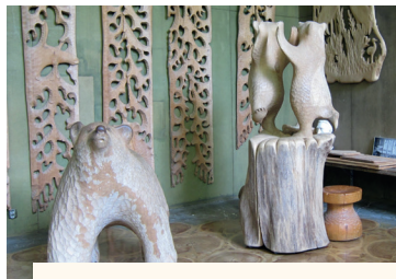
Lieksan museoihin museokortilla

Avoinna 15.5.–15.9. joka päivä klo 10–18, suljettu 19.6. Vapaa pääsy ulkomuseoon 18.5, 3.6 ja 26.8. Liput: Yhteislippu Olavi Martikainen – Viimeinen boheemi -näyttelyyn ja ulkomuseoon: 16 € / 14,5 € / 0 €. Opastukset joka päivä klo 10:30, 13 ja 16, 3 € / hlö. Katso kaikkien lipputuotteiden hinnat verkkosivuiltamme.